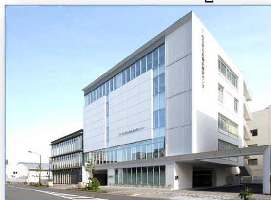
名古屋市医師会健診センター